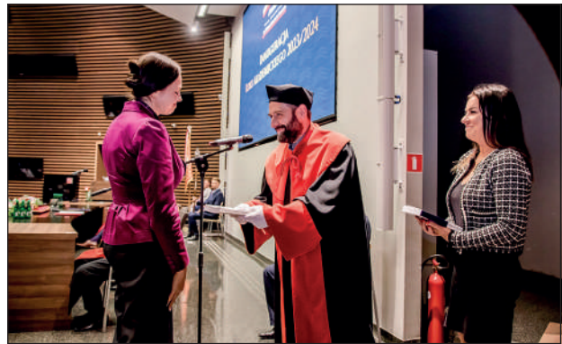
Dziekan Filii w Nowym Tomyślu wręcza wyróżnienie