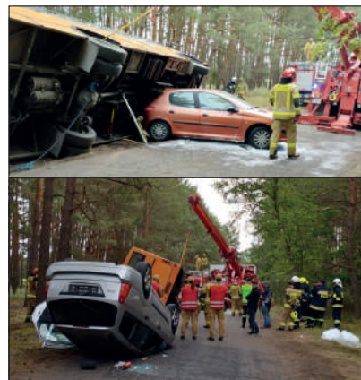
Ćwiczenia zespołów ratunkowych podczas zdarzenia drogowego

Organizatorom dziękujemy z możliwość wspólnych ćwiczeń.