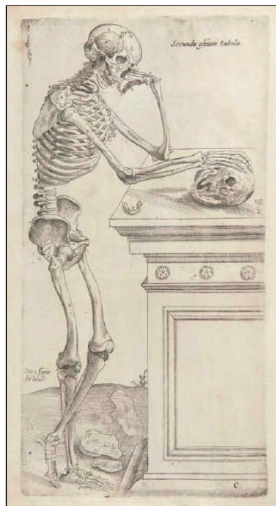
Andreas Vesalius, Tablica anatomiczna. Międzioryt z Anatomii Vesaliusa, 1617, będącej skrótem jego wielkiego dzieła De Humani Corporis Fabrica.