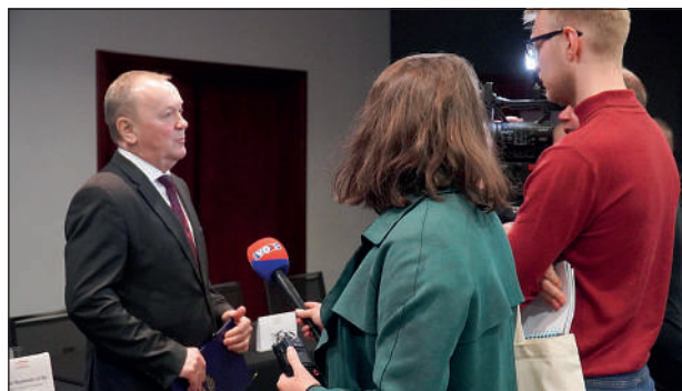
JM Rektor udzielający wywiadu mediom