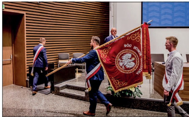
Wprowadzenie Pocztu Sztandarowego