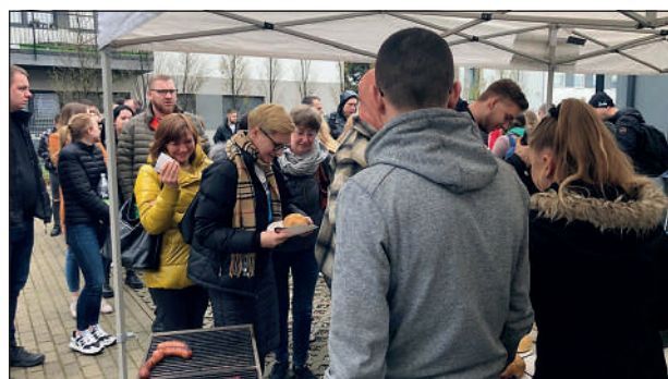
Ciepły poczęstunek po wykładzie