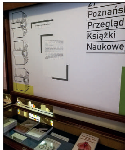
Gabloty naszej Akademii