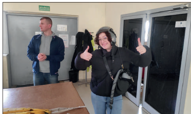
Zwiedzanie Sekcji wysokościowej