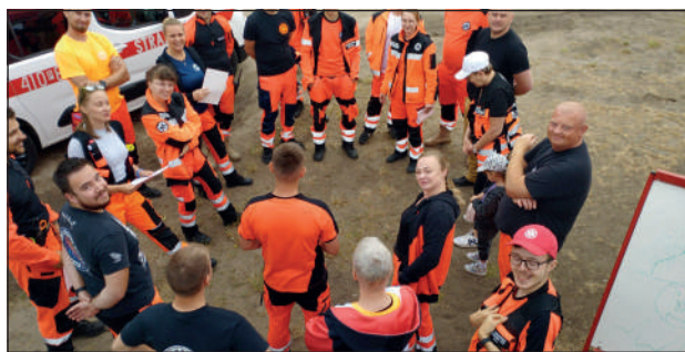
Uczestnicy ćwiczeń podczas odprawy