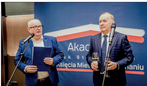
Wystąpienie Kancelarza i JM Rektora ANSM

Wykład zatytułowany „Poznań za pierwszych Piastów” był niezwykle ciekawy, Prowadząca przykuła uwagę audytorium, bez trudu budząc żywe zainteresowanie w szeregach studentów, co jak wiedzą wszyscy nauczyciele i wykładowcy nie jest łatwym zadaniem. Prezentacja zawierała wiele atrakcyjnych ilustracji ukazujących ślady odległej przeszłości – pamiętające czasy pierwszych Piastów przedmioty odnalezione, zbadane, opisane i pieczołowicie