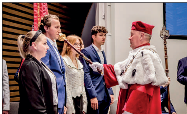
Immatrikulacja studentów I roku