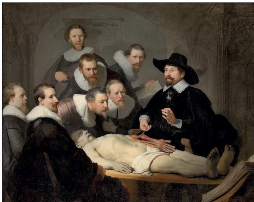
Rembrandt, Lekcja anatomii doktora Tulpa , 1632.