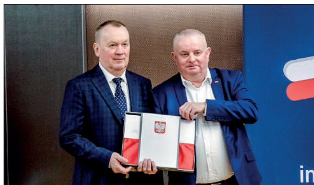
JM Rektor i Kancelarz prezentują list od Prezydenta RP Andrzeja Dudy