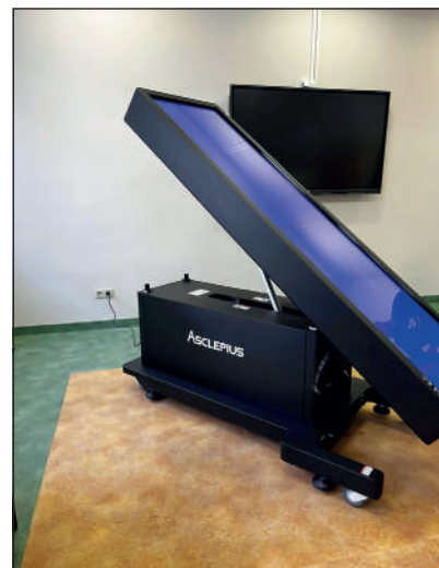
Stół anatomiczny Asclepius