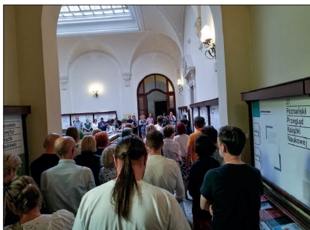
Uroczyste otwarcie Przeglądu