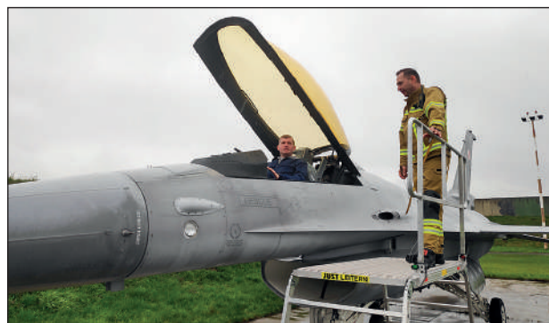
Prezentacja wyposażenia samolotu F-16