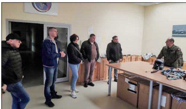
Zwiedzanie Sekcji wysokościowej