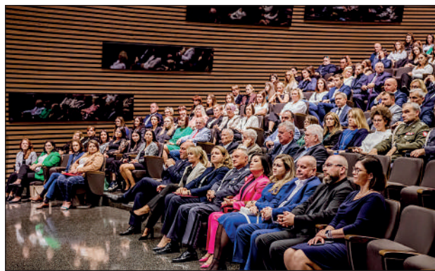
Widok na salę - w pierwszym rzędzie zaproszeni Goście