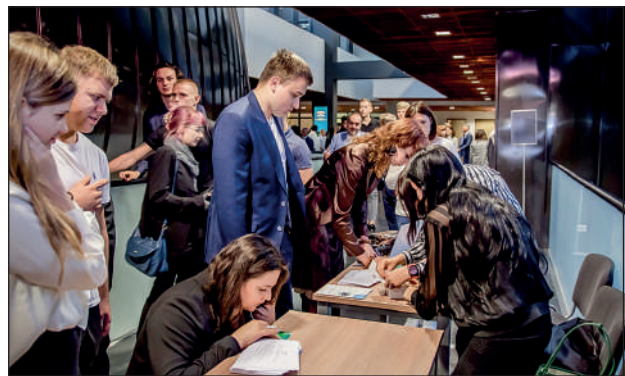
Studenci I roku odbierają legitymacje studenckie