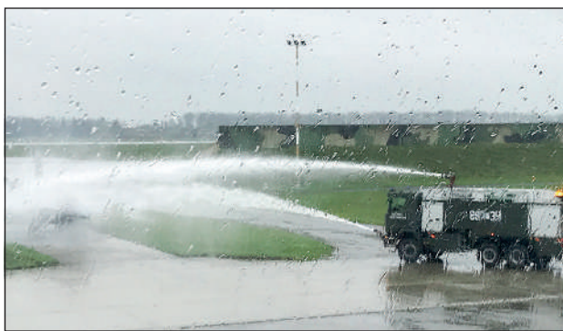
Symulowana akcja gaszenia F-16 przez Wojskową Straż Pożarną