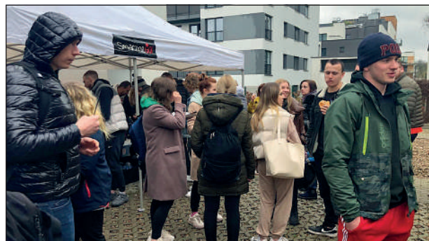
Ciepły poczęstunek po wykładzie