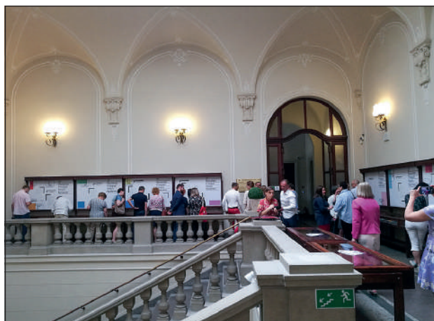
Uczestnicy Przeglądu podczas oglądania wystaw poszczególnych oficyn