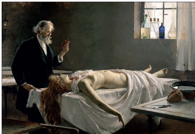
Enrique Simonet (1866–1927), Autopsja , 1890.

Zapraszam wszystkich studentów Wydziału Nauk Medycznych i Wydziału Lekarskiego na niezapomnianą przygodę z anatomią.