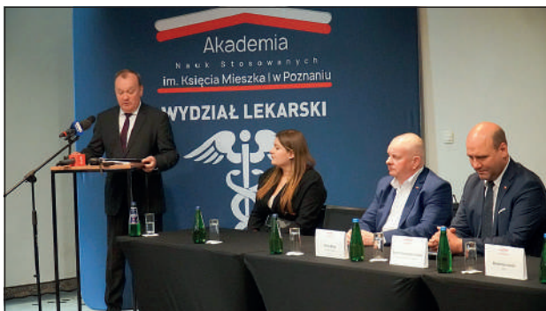
Wystąpienie JM Rektora ANSM