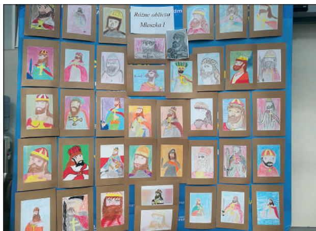
Mieszko I oczami studentów kierunku pedagogika