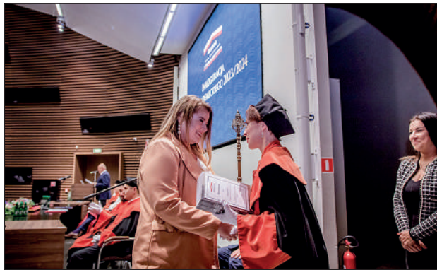
Dziekan Wydziału Nauk Społecznych wręcza wyróżnienie