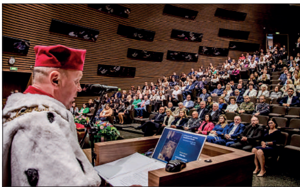
Wystąpienie JM Rektora ANSM