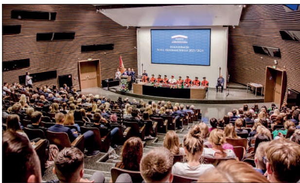
Widok na Audytorium