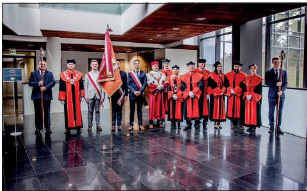
Senat ANSM, Straż Rektorska i Poczet Sztandarowy