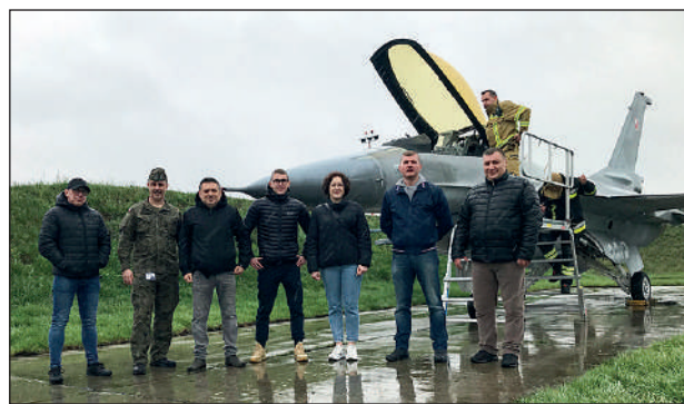
Uczestnicy zajęć na tle samolotu F-16