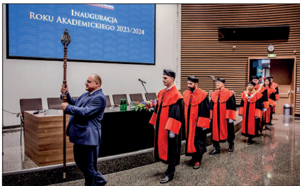
Wejście Senatu Akademii na salę