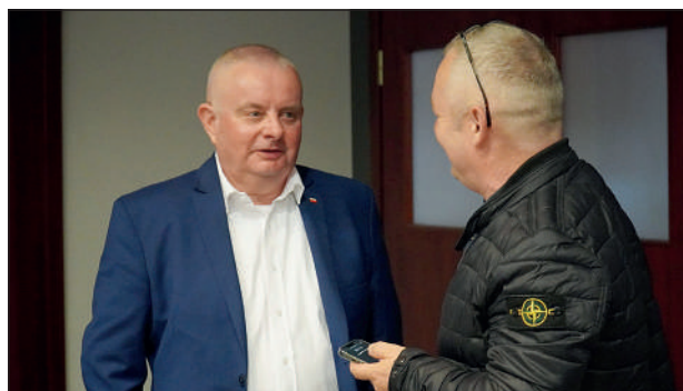
Kanclerz-Założyciel udzielający wywiadu