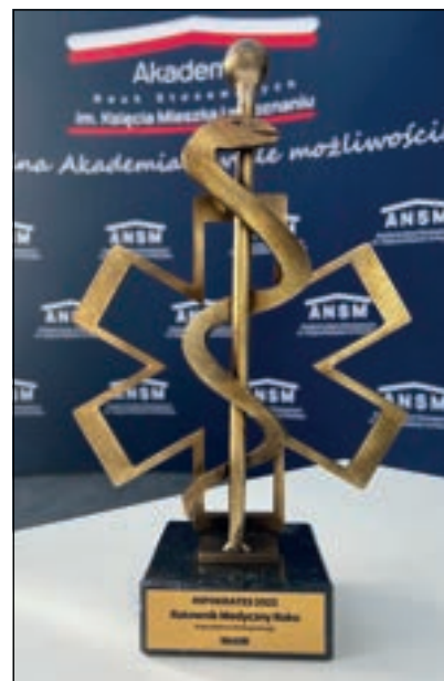
Dyplomy oraz Statuetka Hipokrates 2022