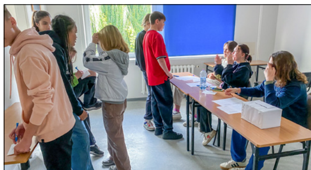
Zdjęcia z wyjazdów do Berlina, Wrocławia i Guben oraz z wyborów do samorządu