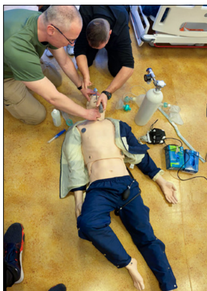
Fotografie ze spotkań Koła Laryngoskop

Do opracowania wykorzystano https://www.estetykaichirurgia.pl/2022/09/west-aesthetic-show/